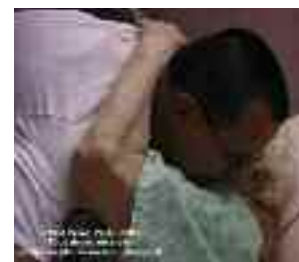
Extrait du film «Patients vulnérables - Soignants exposés»