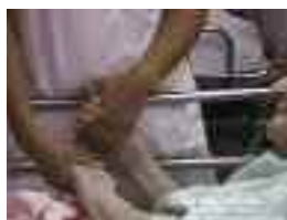
Extrait du film «Patients vulnérables - Soignants exposés»

Ce film a été réalisé en collaboration avec les soignants du CHU de Rouen, dans le cadre d'une Formation-action, afin de revaloriser le travail en gériatrie.